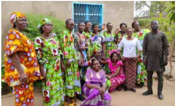
L'équipe enseignante de l'École Gabriel Balet

A u Tchad, la mission de la Communauté du Chemin Neuf se déploie dans un contexte particulièrement éprouvant : crise sociale, tensions aux frontières, grande précarité. Pourtant, au cœur de ces fragilités, une espérance bien vivante continue de grandir. À Ku Jéricho, le centre de santé Saint Luc accueille chaque jour les plus démunis, sans distinction. Soins, maternité, nutrition, ophtalmologie : malgré des moyens limités, chaque