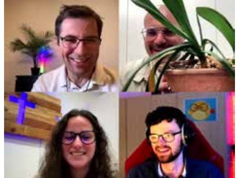
L'équipe joyeuse et dynamique du projet Coach Carême

Quel chemin parcouru ensemble pour ce Coach Carême 2026 ! L'idée de départ était toute simple : créer, au nom de la Communauté du Chemin Neuf, un parcours de Carême sur les réseaux sociaux et en paroisse, à l'attention des commençants et recommençants dans la foi. Très vite une petite équipe de jeunes s'est mise en place autour de la paroisse de la Sainte Trinité à Grenoble. Certains préparant leur baptême, d'autres découvrant la foi chrétienne ou revenant à l'Église. Le parcours a été construit avec eux et pour eux, qu'il s'agisse des thèmes abordés ou de la manière de les traiter : tout a été pensé ensemble ! Au terme de ce temps de Carême, les différentes vidéos réalisées ont totalisé plus de 2,5 millions de vues sur les différentes plateformes où elles ont été diffusées : Instagram, Tiktok, Facebook, Youtube... Il y a eu aussi des fous rires mémorables et des échanges particulièrement marquants lors des rendez-vous en direct sur Youtube où l'équipe tâchait de répondre chaque semaine aux questions des participants. Et beaucoup plus important encore : certains nous ont partagé leur