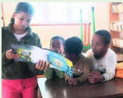
Transmettre le goût des livres dès le plus jeune âge

Découvrez toutes les missions sociales et pastorales sur le site de la Communauté au Tchad