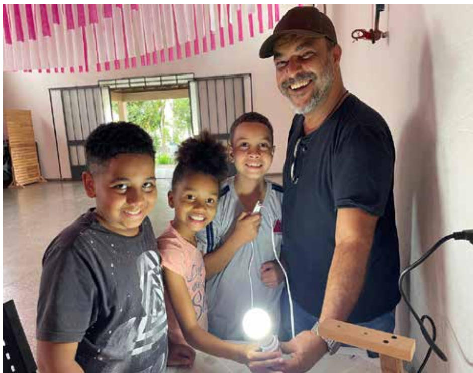
Atelier électricité : Que la lumière soit !