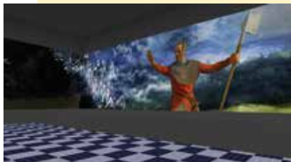
Extrait du storyboard du projet

difficulté particulière. La Communauté s'emploie à rassembler les 9 700 € nécessaires pour assurer l'approvisionnement en eau du foyer.