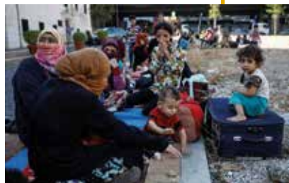
Une famille de déplacés au Liban

Les frappes israéliennes au Liban ont fait plus d'un million de déplacés. Les besoins sont énormes pour aider les nombreuses familles qui dorment dans les rues et cherchent un refuge. L'association Esperanza est une mission de la Communauté du Chemin Neuf au Liban qui vient en aide aux démunis au nord de Beyrouth. La cagnotte organisée par la Communauté en Europe a donné lieu à un élan de générosité extraordinaire. Grâce à la mobilisation des donateurs, 60 000 € ont pu être envoyés au Liban pour répondre à l'urgence qui touche ces familles et les accompagner au quotidien.