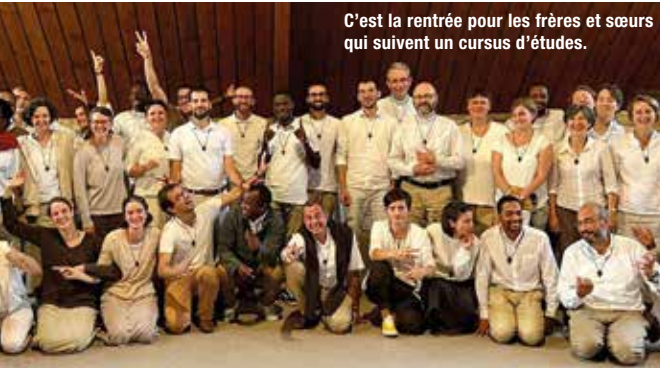
C'est la rentrée pour les frères et sœurs qui suivent un cursus d'études.

La formation académique des frères et sœurs de la Communauté poursuit quatre finalités essentielles. La première est la recherche de la vérité , notamment la vérité chrétienne, en se confrontant aux grandes questions existentielles comme la liberté, la nature de Dieu et de l'homme. La deuxième finalité concerne l'affermissement de la personnalité . En s'imprégnant des grandes pensées philosophiques et théologiques, l'individu structure sa personnalité, développe sa connaissance de soi et ses capacités intellectuelles et expressives, ce qui est crucial pour une vie chrétienne durable. La troisième finalité est la mission , qui implique une crédibilité personnelle pour rendre témoignage de sa foi de manière claire et compréhensible, et répondre aux questions des autres. Cela inclut aussi la formation au service pastoral et missionnaire. Enfin, la dernière finalité est l'intégration à l'histoire de l'Église , une histoire millénaire qui façonne l'identité chrétienne et unit chaque individu à la tradition et aux institutions de l'Église. Cette formation permet d'incorporer sa propre histoire dans la grande histoire chrétienne. L'enseignement, modèle central dans la vie de Jésus, souligne l'importance de la transmission du savoir et de la vérité, faisant de chaque croyant un apprenant, réceptif à la sagesse divine et au goût du savoir.