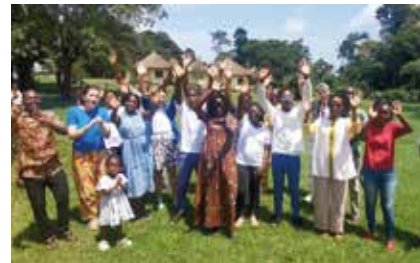
Lancement de la nouvelle promo

Cette année ce sont 18 jeunes de 7 nationalités et 2 couples qui se sont embarqués pour cette belle aventure de la formation à Tibériade (3h à l'ouest d'Abidjan) en Côte d'Ivoire. La formule est nouvelle parce que dorénavant tout se vit en parallèle avec la formation à l'abbaye d'Hautecombe, sur 2 semestres de septembre à décembre et de janvier à juin. Ainsi des passerelles sont possibles et des jeunes européens peuvent vivre cette expérience au cœur de l'Afrique. Le centre, géré par une équipe de 5 personnes de la Communauté du Chemin Neuf, a été réhabilité grâce à votre générosité. Ce redémarrage est donc très encourageant ! Vous pouvez aider ces jeunes africains qui souhaitent se former comme disciples missionnaires en les parrainant. Le coût de la formation s'élève à 2 500 € par semestre pour un jeune.