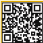
Présentation détaillée du projet