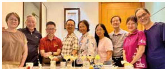
Les couples d'Emmaüs à Hong-Kong, anciens responsables Cana

Les six couples anciens responsables de Cana, qui ont laissé la place à une jeune génération de responsables pour accompagner les 50 couples de la fraternité Cana de Hong-Kong, souhaitent continuer de se former, non pour grandir en responsabilité, mais bien en maturité spirituelle. Comme le dit le Pasteur Rick Warren : « Leaders are learners ». Cette formation a lieu toutes les 3 semaines et s'appuie sur les 5 Essentiels qui sont les objectifs de Dieu pour notre vie (la fraternité, la prière, la formation, le service et l'évangélisation). Nous poserons, dans ce parcours sur 2 ans, les fondations d'une vie bien orientée sous le regard de Dieu. Passionnant, pour des passionnés de Jésus. Tout un programme !