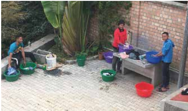
Les étudiants du foyer font leur lessive avant l'étude

La Communauté anime un foyer d'étudiants sur les hauteurs de Tananarive, capitale de Madagascar. Ce foyer a été construit par la Communauté en 2016 afin de permettre à 24 étudiants de poursuivre une formation universitaire. Les conditions de vie des étudiants sont rendues difficiles par une alimentation en eau et en électricité très aléatoires (les installations et réseaux ont été construits il y a 60 ans pour une ville de 500.000 habitants. Ils n'ont jamais été modifiés, pour une ville qui avoisine aujourd'hui les 4 millions d'habitants). On ne sait jamais si le robinet va couler lorsqu'on l'ouvre... Par chance, une étude récente a montré