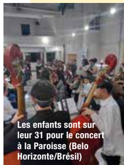
Les enfants sont sur leur 31 pour le concert à la Paroisse (Belo Horizonte/Brésil)

Pour entendre les enfants de l'Orchestra Jovem das Gerais