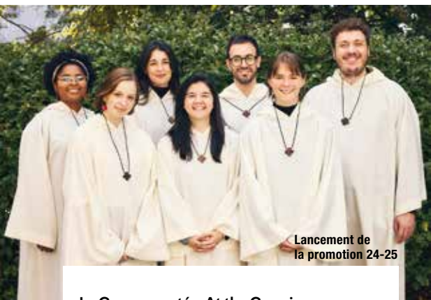
Lancement de la promotion 24-25